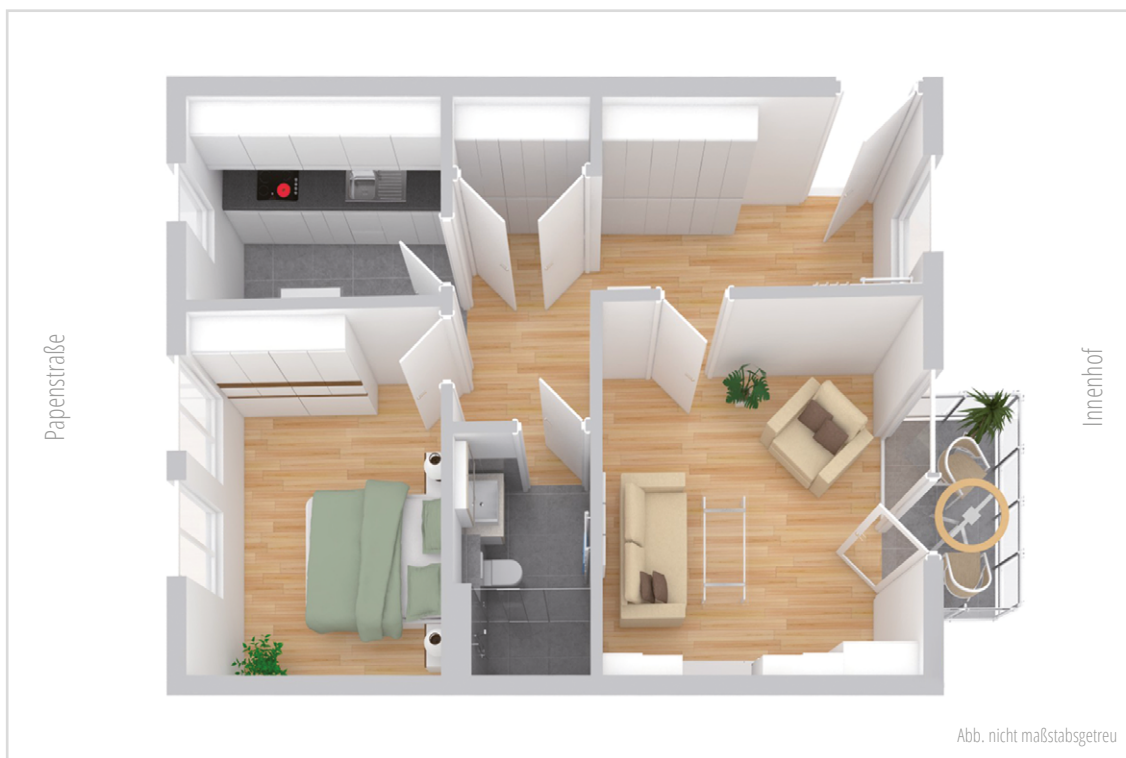
Abb. nicht maßstabsgetreu